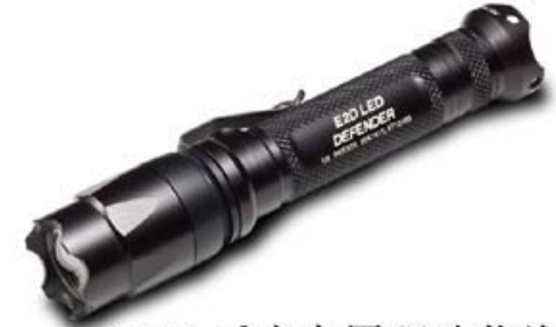
LED 手电专用驱动芯片