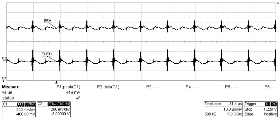
图 3 ADC 供电电压 3.3V 以及地线电压波形