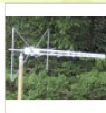
对数周期接收天线