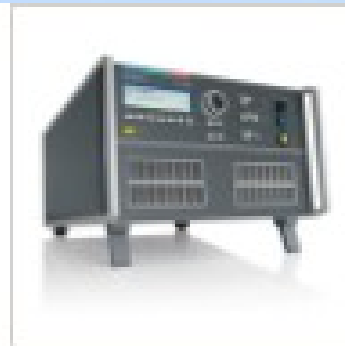
EM TEST 抗干扰测试仪